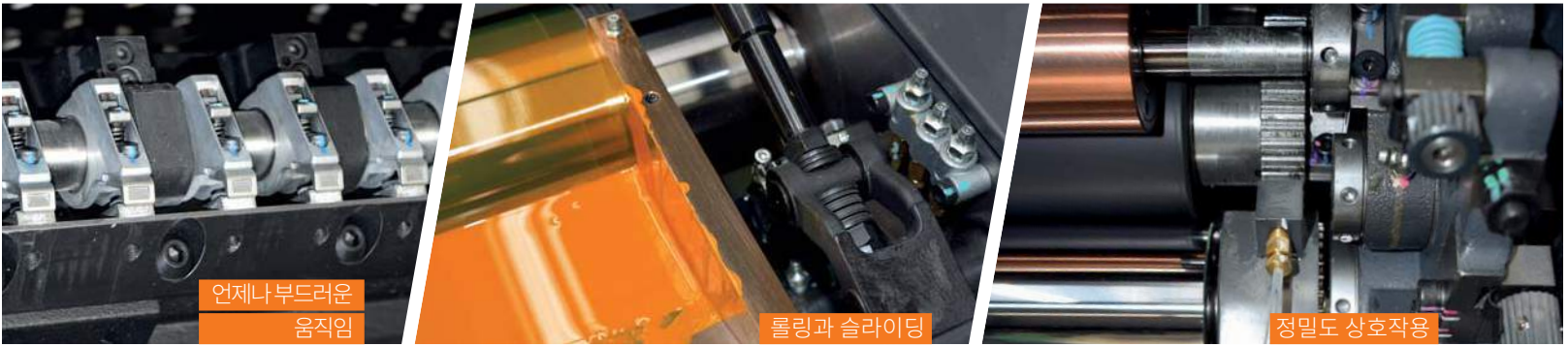
언제나 부드러운 움직임