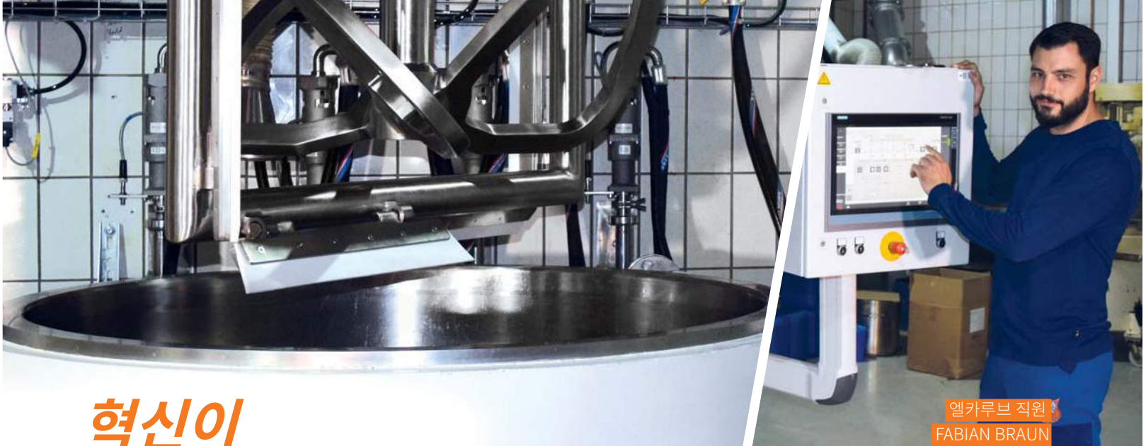
엘카루브 직원 FABIAN BRAUN