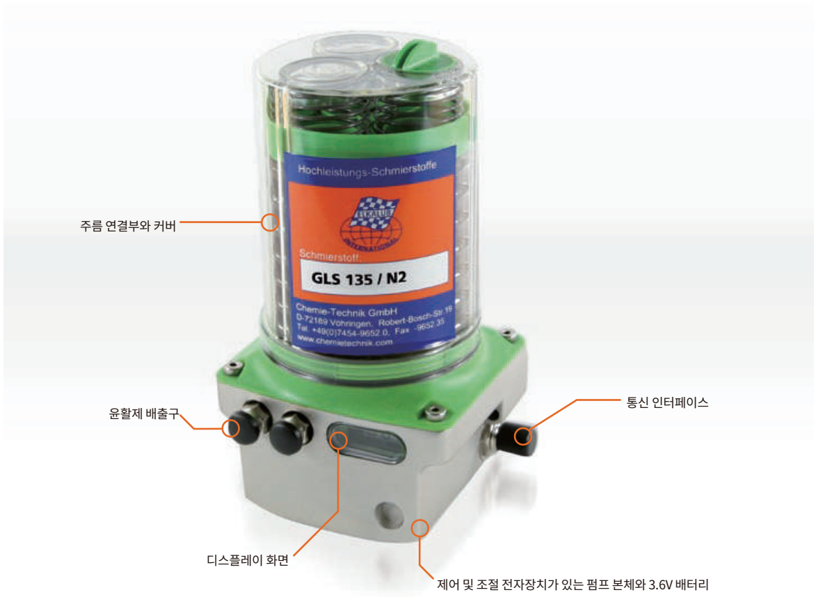
이미지: FlexxPump 402B